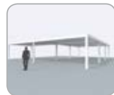
Múltiples partes acoplables en lado span y pivot