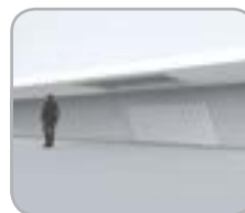
Integrado en una apertura existente