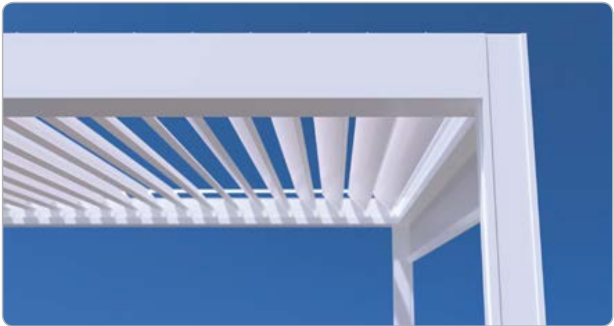
Protección solar resistente al viento integrada basada en la tecnología Fixscreen®