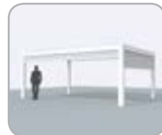
Combinación con Fixscreen® integrado