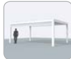
Lado Pivot equipado con Fixscreen®

Una estética y un ambiente diferente se puede conseguir integrando el Loggiascreen® 4FIX y paneles correderas Loggiawood®. Loggiascreen® 4FIX puede llevar el mismo tejido que los estores enrollables verticales. También se puede optar por un ambiente más cálido y acogedor eligiendo los paneles correderas Loggiawood® con lamas de WRCedar. ¡La solución perfecta para crear puertas correderas!