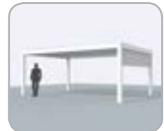
Lado de lamas equipado con Fixscreen®