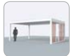
Lado de lamas equipado con Loggiawood® o Loggiascreen® 4FIX