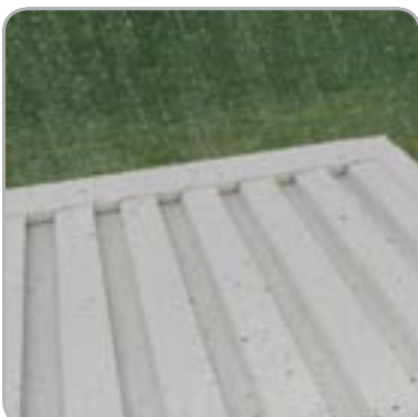
Techo de lamas estancas al agua