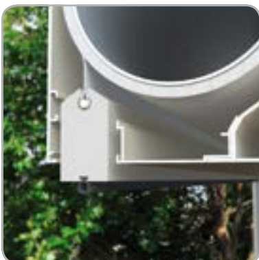
Estores de protección solar integrados: el perfil de contrapeso desaparece en el cajón