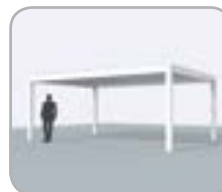
Independiente (4 columnas)