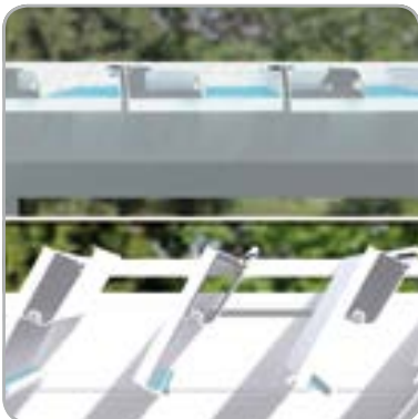
Desagüe controlado cuando se abren las lamas