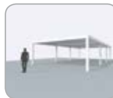
Múltiples partes acoplables en lado span o pivot