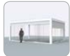
Lado pivot o de lamas equipados con vidrio corredero, eventualmente combinado con Fixscreen®.