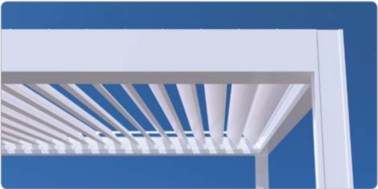
En posición abierta: protección solar y ventilación ajustable