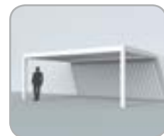
Acoplado a una pared (2 columnas)