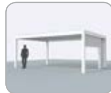
Lado pivot o de lamas equipados con Fixscreen® integrado, combinado con una puerta deslizante utilizando Loggiascreen® 4FIX o Loggiawood®