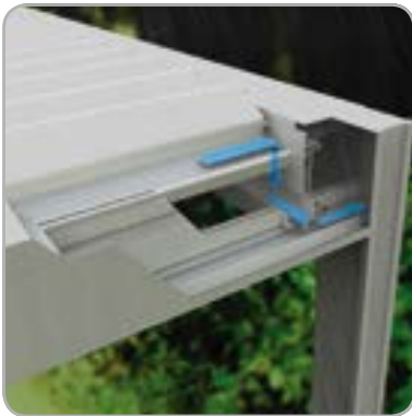
Desagüe eficiente e invisible